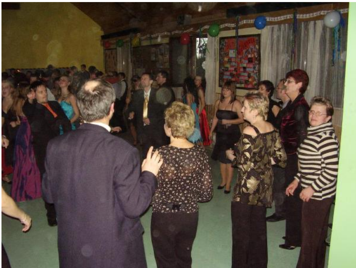
A takto sa zabávali naši profesori.